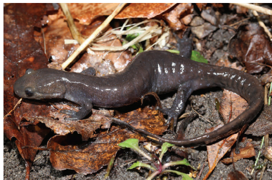
Les photos en bordure par Crowley (2016). De la gauche: Salamandre à deux lignes, salamandre tachetée, triton à points rouges et salamandre à points bleus. Photo ci-haut de la salamandre de Jefferson par Gillingwater (2016). Salamandre tachetée avec ulcères. Photo par: Mark Blooi (2016).